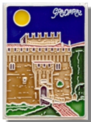
Art. GRAD05/ang Art. GRAD06/mag