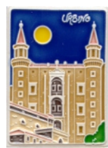
Art. URB04A/ang Art. URB05A/mag